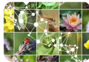
Biodiversidad, Geodiversidad, Paisaje