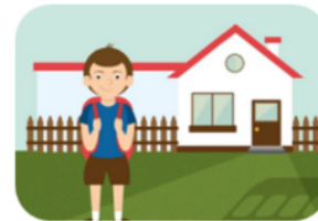
Entorno inmediato: Colegio y Casa

ACTIVIDADES DE CONTACTO DIRECTO CON EL ENTORNO