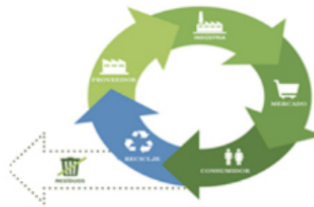
Residuos: prevención, reutilización, reciclaje