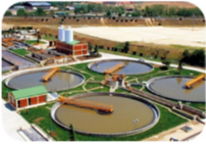
Agua: Ahorro y Gestión