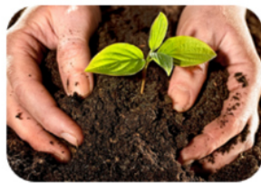
Suelo y Fertilidad