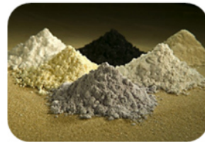
Recursos Geológicos y Materias Primas