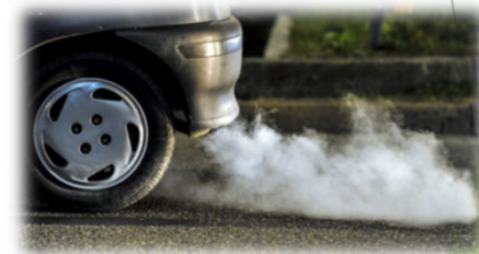
Emisiones a la atmósfera