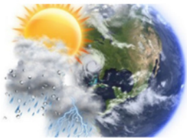
Ciclos estacionales y climáticos